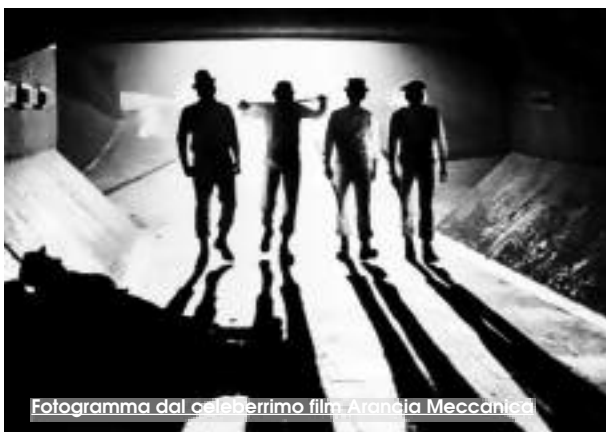
Fotogramma dal celeberrimo film Arancia Meccanica