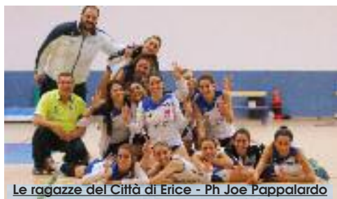
Le ragazze del Città di Erice