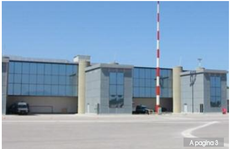
A pagina 3