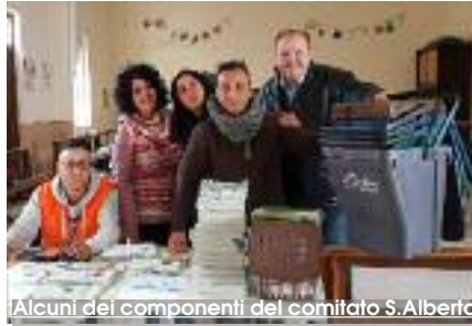
Alcuni dei componenti del comitato S. Alberto