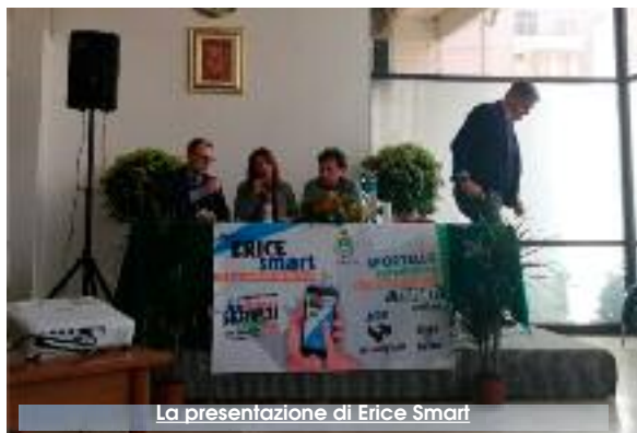
La presentazione di Erice Smart

Comune di Erice? Tramite lo sportello telematico, si potrà consultare la propria situazione tributaria, stampare i propri dati anagrafici, si potranno effettuare dei pagamenti on line in relazione ad alcuni servizi (tra cui il pagamento di multe) e accedere all'area di conteggio IMU e TASI. La piattaforma, potrà inoltre essere utilizzata per effettuare delle segnalazioni geolocalizzate e corredate da foto. Per una semplice richiesta di informazione o consultazione non è richiesta la registrazione, se invece si volesse interagire e pienamente usufruire dei servizi on line bisognerà registrarsi nell'apposita area. Il progetto "Erice smart" è stato ottimizzato con l'ideazione di una applicazione (scaricabile mediante smartphone) che dà accesso immediato alle informazioni e alle comunicazioni del Comune. Scaricando gratuitamente l'applicazione "Municipium", l'utente potrà da un lato inviare le proprie segnalazioni al Comune (in merito a disagi e eventuali malfunzionamenti)